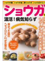
『ショウガで温活!病気知らず』 マキノ出版