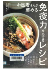
『お医者さんが薦める 免疫力をあげるレシピ』 大塚 亮/著 三空出版