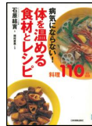
『病気にならない! 体を温める食材とレシピ』 石原 結実/著 田村 直美/料理 日本実業出版社