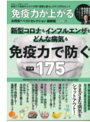
『免疫力が上がる お得技ベストセレクション』 晋遊舎