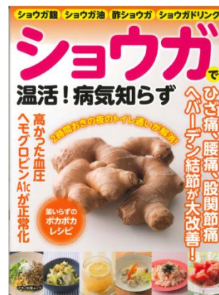
『ショウガで温活! 病気知らず』 マキノ出版