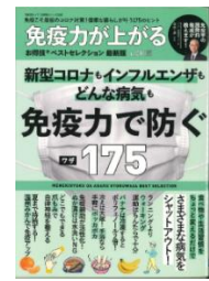
『免疫力が上がる お得意ベストセクション』 晋遊舎