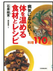
『病気にならない! 体を温める食材とレシピ』 石原 結実/著 田村 直美/料理 日本実業出版社