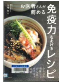
『お医者さんが薦める 免疫力をあげるレシピ』 大塚 亮/著 三空出版