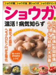
『ショウガで温活! 病気知らず』 マキノ出版