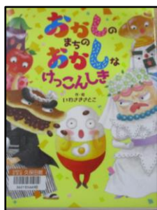
「おかしのまちのおかしなけっこんじき」