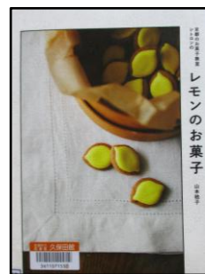
「京都のお菓子教室 シトロンのお菓子」