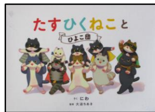
「たすひくねことひよこ団」