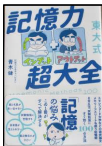
「東大式記憶力超大全」