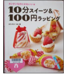
「10分スイーツ& 100円ラッピング」 まちやま ちほ／著 理論社