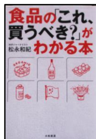
「食品の「これ、買うべき？」がわかる本」