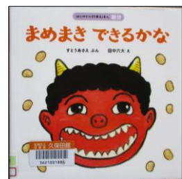
「まめまきできるかな」 すとう あさえ／文 田中 六大／え ほるぷ出版