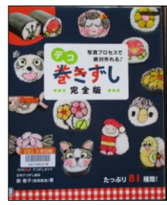
「デコ巻きずし」 飾 卷子／著 ブティック社