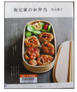
「有元家のお弁当」 有元 葉子／著 文化学園文化出版局