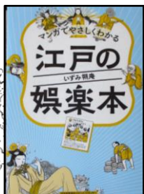
「マンガでやさしくわかる 江戸の娯楽本」