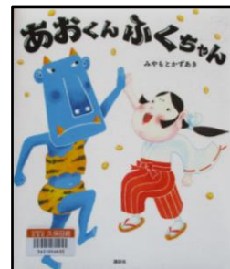
「あおくんふくちゃん」