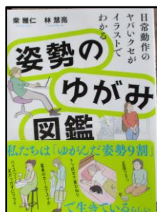
「姿勢のゆがみ図鑑」