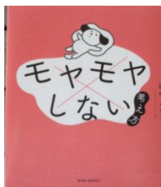
「モヤモヤしない考え方」