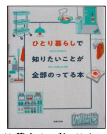
「ひとり暮らしで知りたいことが 全部のってる本」 主婦の友社／編 主婦の友社